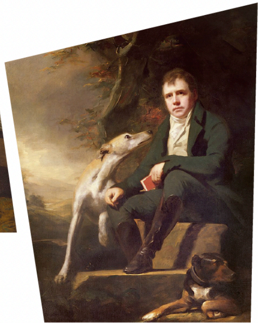
Sir Henry Raeburn (1756-1823) 'Portrait Sir Walter Scott' (1808)

en ander beter te begrijpen. Meer dan de eeuwen ervoor wordt de achttiende gekenschetst door een rijke opeenvolging van stijlen en stromingen. Het is de eeuw die begint met de kracht van de Barok, gevolgd door de elegantie van de Rococo. Het is vervolgens ook de 'Eeuw van de rede', de 'Verlichting' waarin de wereld maakbaar lijkt. De opkomst van het Neoclassicisme past bij het rationalisme van de tijdgeest maar ook hier komt een reactie op en dat is wat we onder 'De Romantiek' (met hoofdletter) verstaan. Waar de 'Verlichting' toekomstgericht is op een wereld van de vooruitgang, bereikbaar geworden door gebruik te maken van het collectieve abstracte menselijke verstand, kennen de vertegenwoordigers van de 'Romantiek' een ander perspectief. Zij benadrukken het individuele aspect en verkiezen het subjectivisme boven het objectivisme, de emotie boven de ratio en het eigene boven het