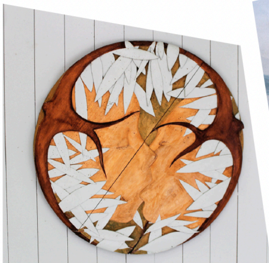
'Liefdeskus' houtsneede door Harry Leurink