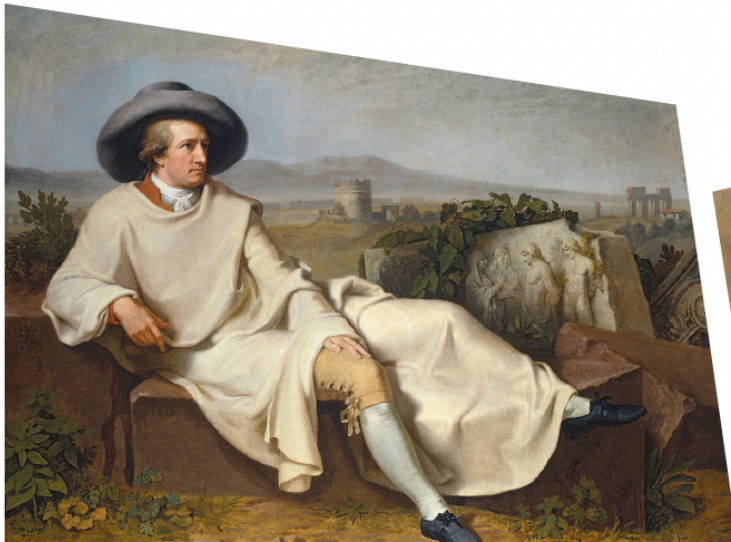
Johann Heinrich Wilhelm Tischbein (1751-1829) 'Goethe in der Campagna' (1787)